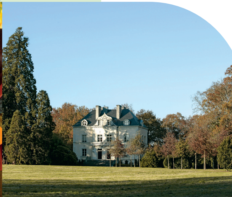
Château de la Fleuriaye, Carquefou