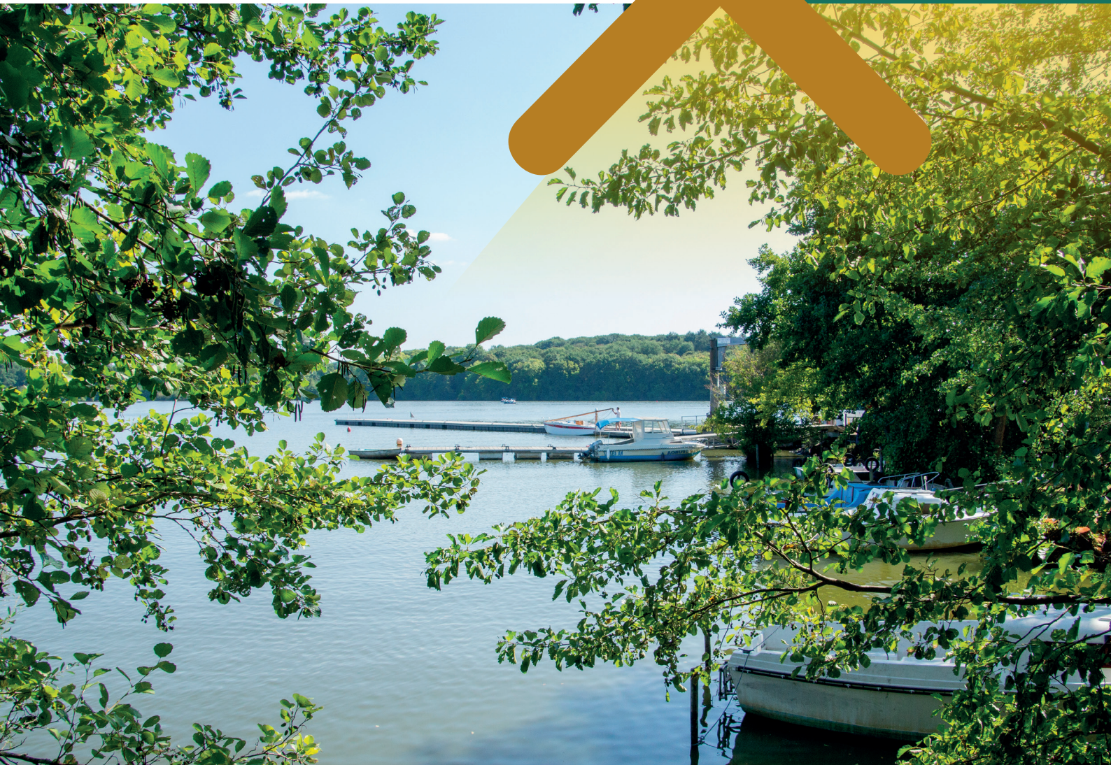
Port Jean, Carquefou

à 1 km du parcours Crapa et du Parc du Charbonneau